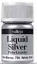
70.796 Oro Blanco White Gold