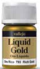
70.793 Oro Rico Rich Gold