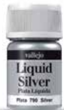
70.790 Plata Silver